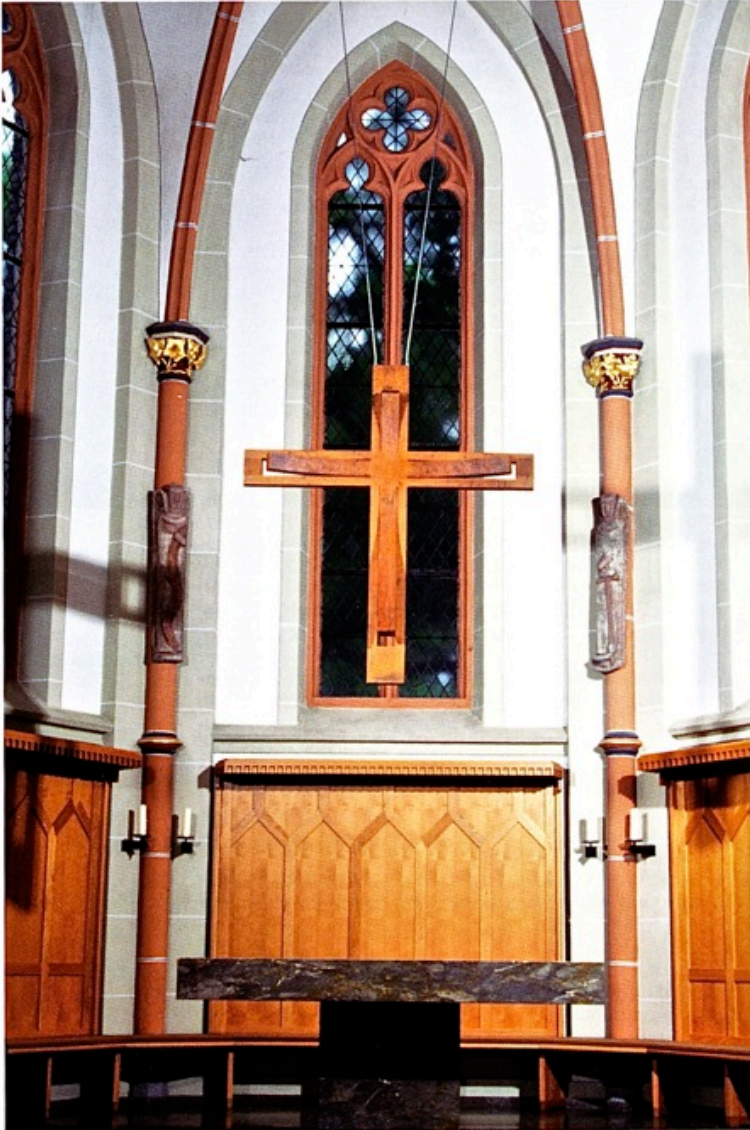
1 Hermann J Kassel, Altarkreuz in St. Evergislus, Bonn-Plittersdorf, Frontansicht

„Eine Stärke der Kunst ist es, den Finger auf die Wunden des Gegenwärtigen zu legen, Fragen und Wünsche, auch Sehnsüchte aufzudecken.“ 1