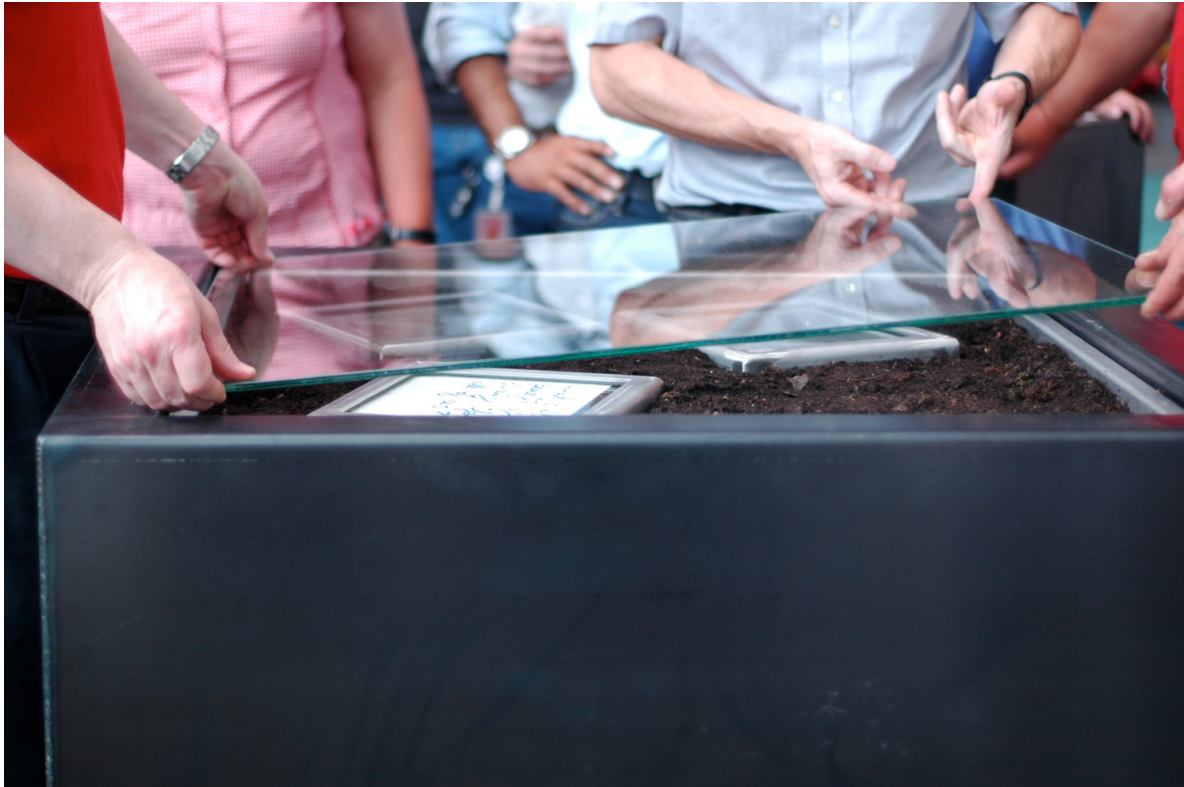
Abb. 2 Teilnehmer legen gemeinsam die abschließende Glasplatte auf den Edelstahlcontainer

und Zersetzung. Das, was für alle sichtbar und erfahrbar wird, was sonst eher abstrakt und nicht greifbar ist, sind Wandel und Transformationsprozesse. Das eigene Spiegelbild in der Glasfläche bezieht den Einzelnen zusätzlich in diesen Prozess mit ein und eröffnet einen Fragenkatalog nach der eigenen Verwurzelung und dem Umgang mit Veränderungen (Abb. 2, Abb. 3, Abb. 4 ).