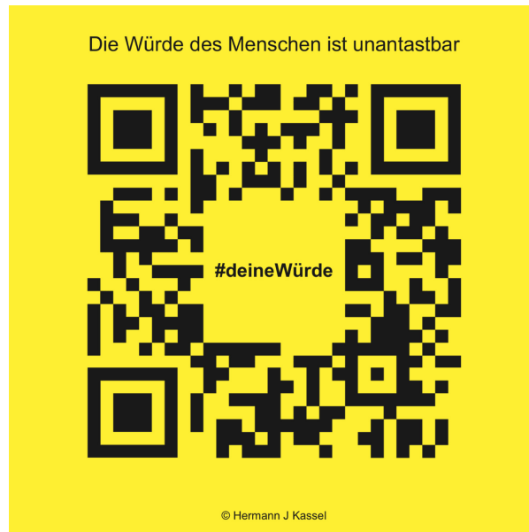
Abb. 11 Werte bilden das Fundament unserer Zusammenarbeit wie unseres Zusammenlebens als Gesellschaft. Logo der Ausstellung und des Projekts #deineWürde über Würde, Werte und Grundgesetz

Die Integration künstlerischer Kompetenzen, Strategien und Denkweisen bewirkt die Erweiterung eigener Perspektiven und schafft so neue Denk- und Gestaltungsräume für Führungskräfte und Mitarbeiter in Wirtschafts- und Wissenschaftssystemen. Die kreativ inspirierten Mitarbeiter schöpfen anschließend bei der Lösung von Problemen aus einem größeren Ideenpool und begegnen den Herausforderungen mit mehr Offenheit, Selbstvertrauen und Mut. Dabei ist hier Kunst in einem weiten Sinne verstanden. Für alle Mitarbeitenden können durch künstlerische Interventionen komplexe Prozesse erlebbar werden, die sonst kaum greifbar sind – und das gilt nicht nur für die Teilnehmer der Interventionen. Durch den dauerhaften Verbleib des Kunstwerks wirken die erarbeiteten Inhalte im Unternehmensalltag weiter und sind lebendiger Ausdruck einer Unternehmenskultur.