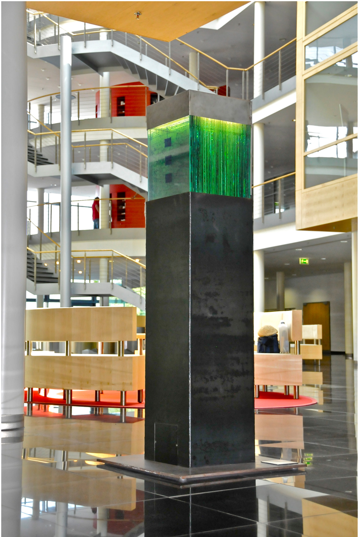
Abb. 4 „Shining future“: Säule aus Stahl, Glas und Licht als leuchtendes Kompendium