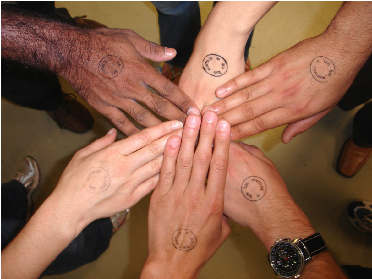
Abb. 9 Die Teilnehmenden halten den Moment nach dem Stempeln ihrer Handrücken fotografisch fest

Die Verwendung der Stempelaktion stellte jedem Teilnehmer die Frage, wo und womit Wertschätzung beginnt. Als Einstieg sollte sich jeder die Stempelaussage „Ich bin wertvoll“ auf den eigenen Handrücken stempeln. Beginnt die Wertschätzung bei mir, bringt mich dieser Satz auf meiner Hand in die eigene Verantwortung für mein Handeln, anstatt diese zu delegieren oder von mir zu schieben. Mit den Stempeln und Kameras ausgerüstet, wurden die Juniormanager gebeten, sich in kleine Gruppen aufzuteilen und durch das Werk und die Betriebshallen zu gehen, um hier mit den Mitarbeitern in Gespräche über Werte und Wertschätzung zu kommen. Mit dem sichtbaren Stempelabdruck auf dem eigenen Handrücken baten sie die Mitarbeiter dann, ihnen ebenfalls den Stempelabdruck auf den Handrücken geben zu dürfen. Obwohl sie am Tag zuvor bereits eine komplette Werksführung erhielten, war kaum ein Kontakt zu den dort arbeitenden Menschen entstanden. Das änderte sich nun. Sie waren mit den unterschiedlichsten Reaktionen und Diskussionen konfrontiert. Die Begegnungen und das Stempeln wurden mit den Kameras fotografisch festgehalten.