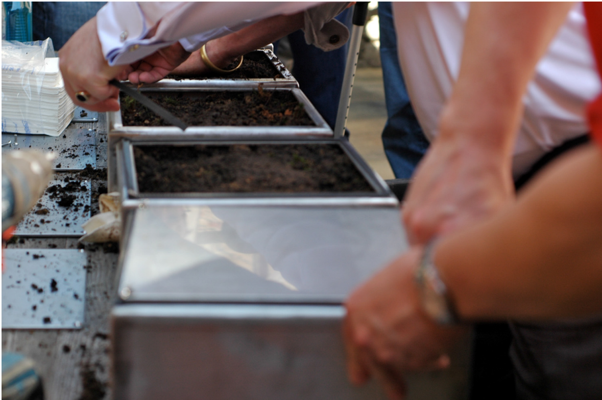
Abb. 1 Teilnehmer füllen die vermischte Erde in die vorbereiteten Edelstahlcontainer

oder Folie aufgetragene Inhalte durch die darin mit eingeschlossene feuchte Erde kontinuierlich verändert. Inhalte und Schriften auf Papier oder Leinwand erfahren hierbei durch biochemische- wie Photosyntheseprozesse eine kontinuierliche Veränderung – bis zur Unkenntlichkeit. Im Laufe der Zeit werden diese ersetzt durch ein natürliches Bild. Auf Folien aufgebraute Inhalte hingegen werden von diesem Prozess nicht verändert und bleiben konstant sichtbar vor dem Hintergrund der stetigen Veränderung (Abb. 1).