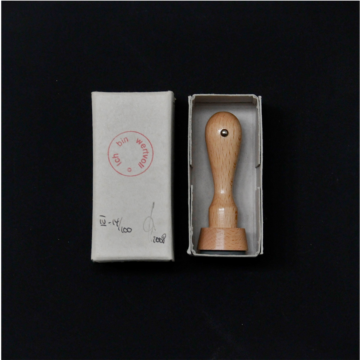
Abb. 10 Jeder Teilnehmer konnte seinen Stempel mitnehmen. Dieser hängt nun in der aktuellen Ausstellung #deineWürde