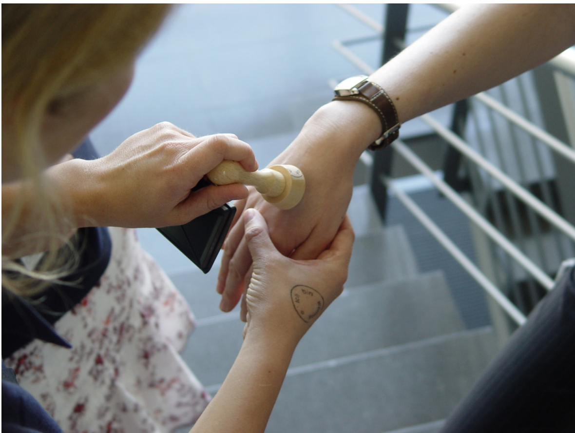
Abb. 8 Eine Teilnehmerin gibt einer Kollegin den Stempelaufdruck „Ich bin wertvoll“ auf den Handrücken

Die Stempeledition mit dem Satz „Ich bin wertvoll“ drückt genau dies aus. Es geht um Wertschätzung uns selbst gegenüber, gegenüber anderen Menschen bis hin zur Wertschätzung von „Dingen oder Gegenständen“. Erstaunlich ist, wie sich etwas geradezu schlagartig in meiner Wahrnehmung, Aufmerksamkeit und Wertschätzung verändert, sobald es mit der Aussage „ich bin wertvoll“ bezeichnet beziehungsweise gestempelt wird. Eine solche Stempelung stößt gerade unter dem Gesichtspunkt einer Wegwerfgesellschaft und der immer aktueller werdenden Frage nach der Geltung und Durchsetzung von Werten in einer modernen Gesellschaft Diskussionen und Reflektionen an. Diesen Stempel sich selbst oder einem anderen Menschen „aufzudrücken“, schafft noch einmal eine sehr besondere Situation (Abb. 8).