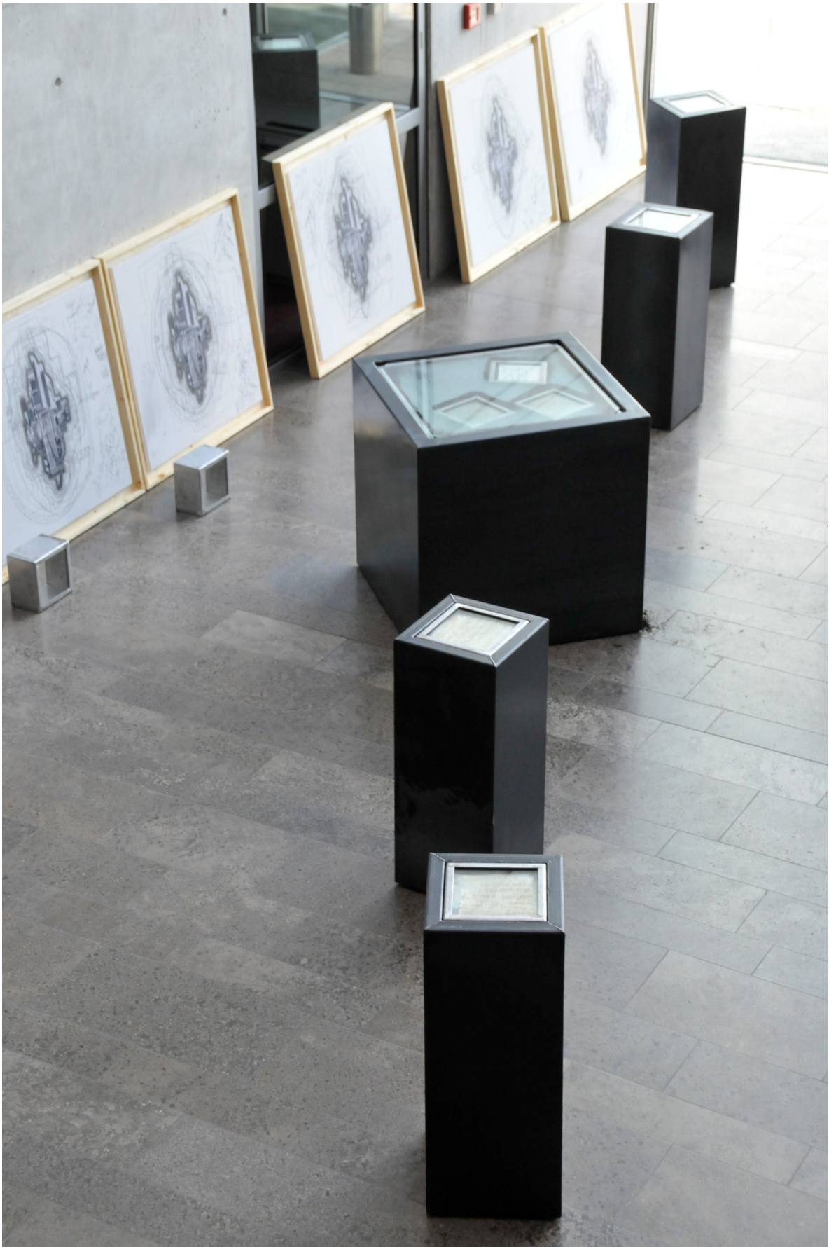
Abb. 3 Die fertigen Erd-Arbeiten und Getriebezeichnungen verbleiben dauerhaft sichtbar im Unternehmen