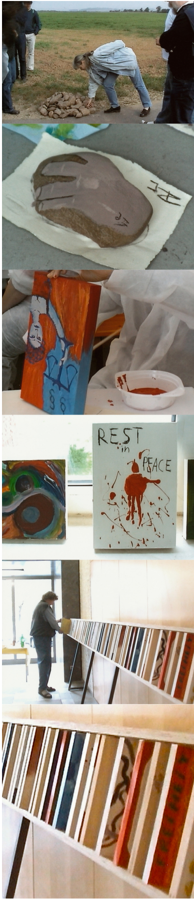
Abb. 7 Standbilder aus dem die Intervention begleitenden Video