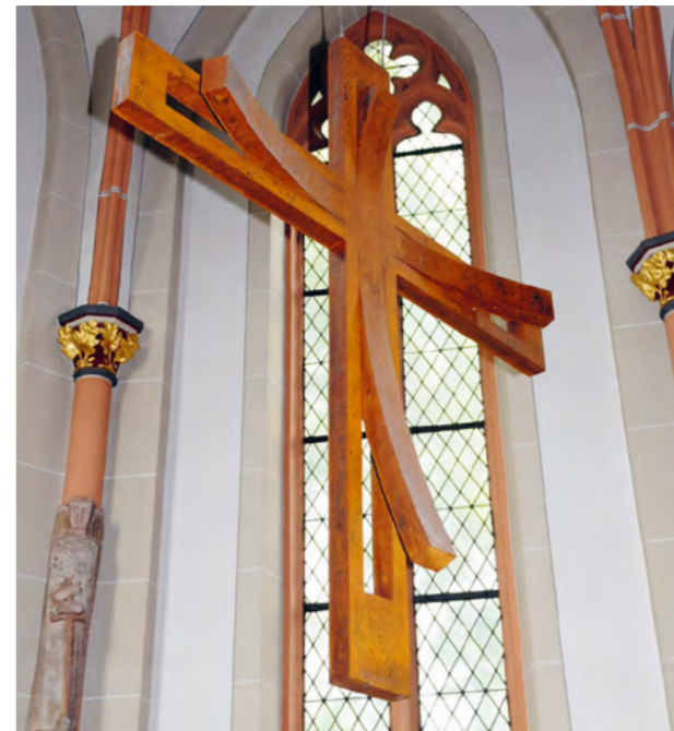
Altarkreuz in der St. Evergislus-Kirche in Bonn.

“This cross, made from solid steel, cut and shaped into a size of 180 x 160 x 40 cm, is the preeminent feature of the sanctuary. From within this cross, another cross emerges, extending its arms towards the viewer, leaning towards them, as if to embrace them, a dynamic moment, yet all the while, this inner cross remains attached to its frame.”