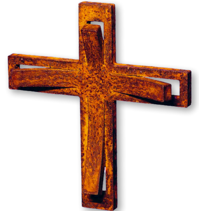
„Aeternus-Kreuz“, korrodiertes Stahl “Aeternus Cross”, Steel, corroded “Croce Aeternus”, Acciaio, corrosivo «Cruz Aeternus», Acero, corroído