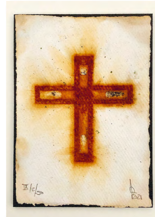
Korrosionsabdruck auf Büttenpapier, Corrosion impression on handmade paper, Impronta di corrosione su carta fatta a mano, Impresión por corrosión en papel fabricado a mano,

Otros tamaños y materiales bajo petición.