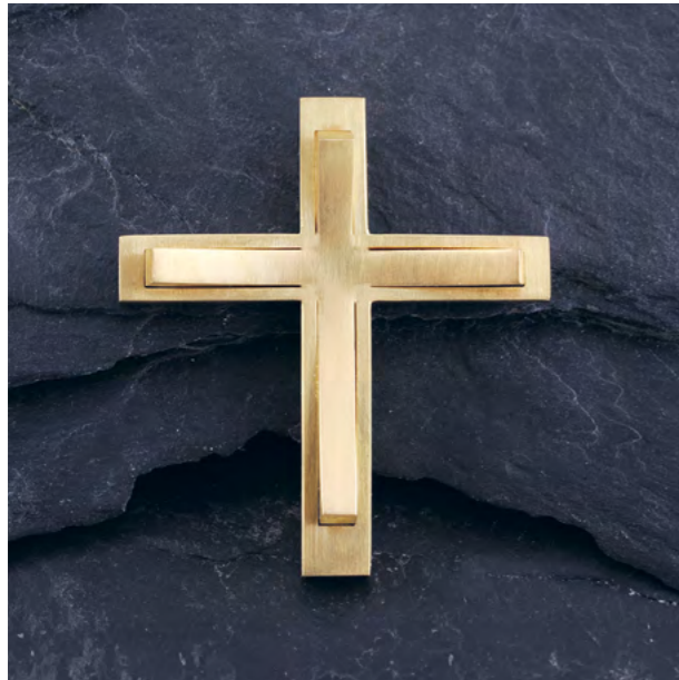
Aeternus-Kreuz, 35 mm Ausführung in Gold und Silber