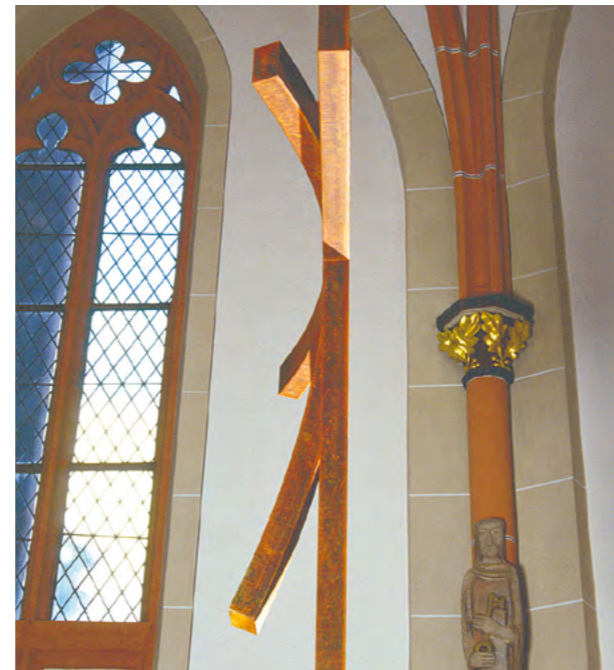
Altar cross in St. Evergislus Church in Bonn.