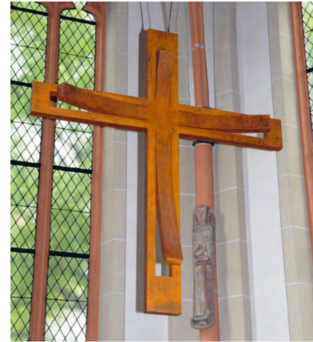
La “Croce Aeternus” per la Chiesa di San Evergislus a Bonn.