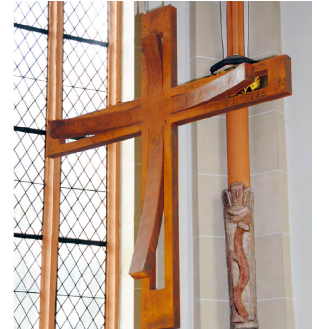
La «Cruz Aeternus» para la iglesia de San Evergislus en Bonn.